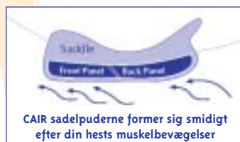
CAIR sadelpuderne former sig smidigt efter din hests muskelbevægelser

CAIR luftsadelpudesystemet betyder farvel til ømhed og træthed, idet systemet praktisk taget udelukker trykpunkter og absorberer stød og tryk. Samtidig er sadelpuden tyndere end de traditionelt stoppede sadelpuder, hvilket gør det lettere at give hesten instruktioner. Sidst men ikke mindst, vil CAIR luftsadelpuderne ikke fremkalde "bump".